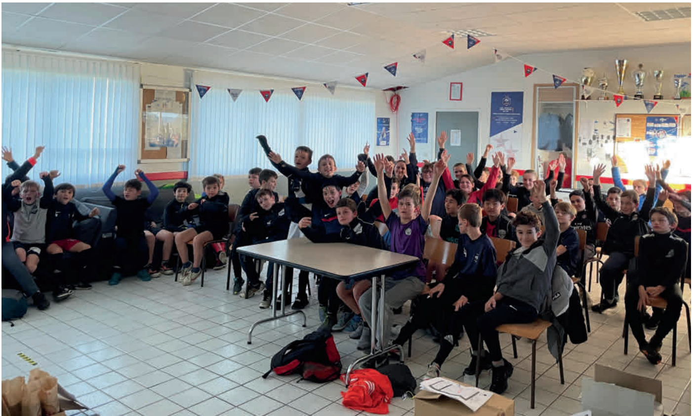
Engouement de nos jeunes de la LFA au cours d'un match de l'équipe de France lors de la coupe du Monde 2022 diffusé à la salle de la Traîne de Champtocé/Loire. Merci les Bleus pour ce beau parcours, merci aux jeunes supporters !

Pour plus de renseignement, notre secrétaire, Sylvie GUILLERM se tient à votre disposition au 06 07 19 46 58.